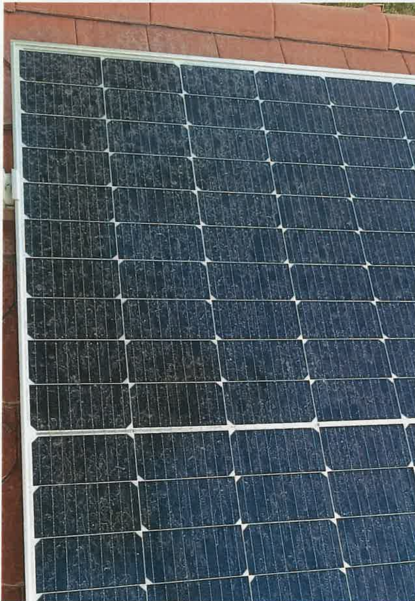
4. kép: A tetőn elhelyezett napeleмен látható porszennyeződés (Irinyi D. u. ..., 2025.)