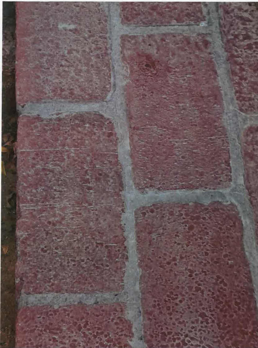
5. kép: A terasz lépcsőjén látható porszennyeződés (Irinyi D. u. , 2025.)