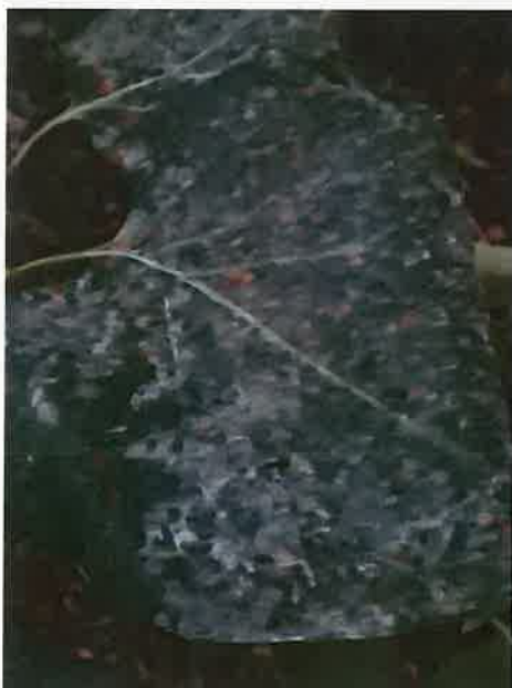
2. kép: A kerti növényeken látható porszenyeződés 2. (Irinyi D. u. ., 2025.)