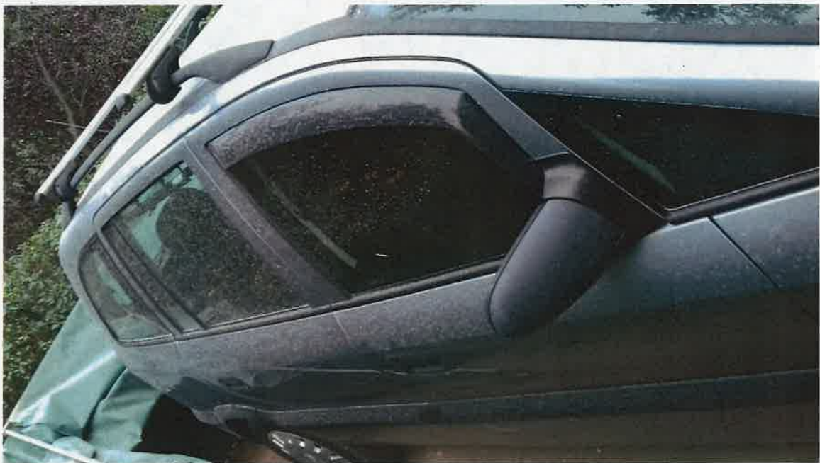
8. kép: A kertben parkoló családi gépkocsin látható porszennyeződés (Irlinyi D. u. , 2018.)