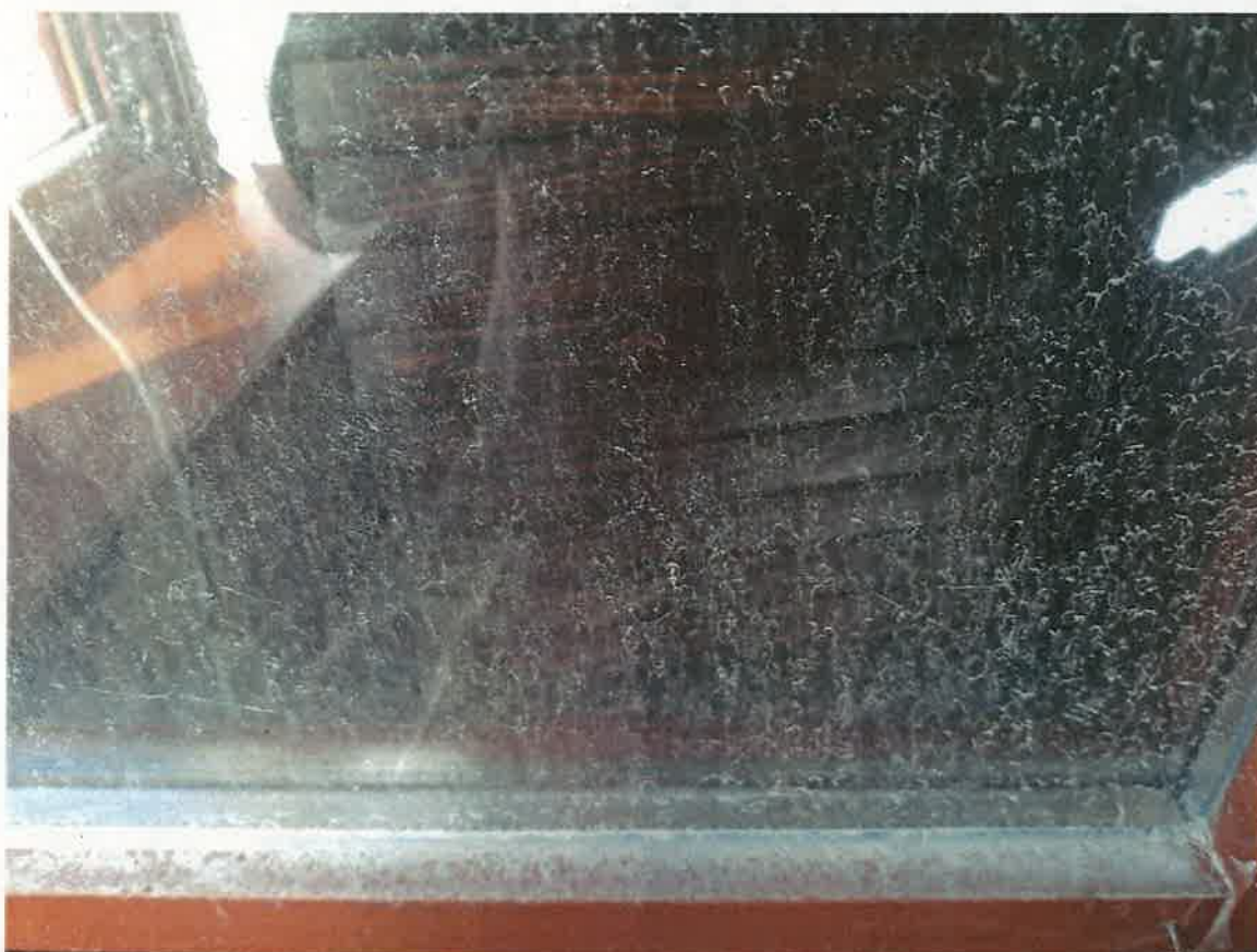
7. kép: A ház ablakain látható porszenyeződés, mely nem a takarítás hiánya miatt jelentkezik 2. (Irinyi D. u. , 2023.)