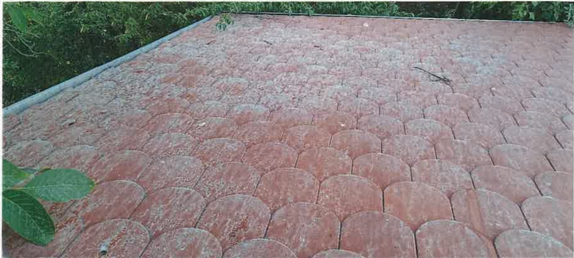
3. kép: A tetőn látható porszennyeződés (Irinyi D. u. ..., 2025.)