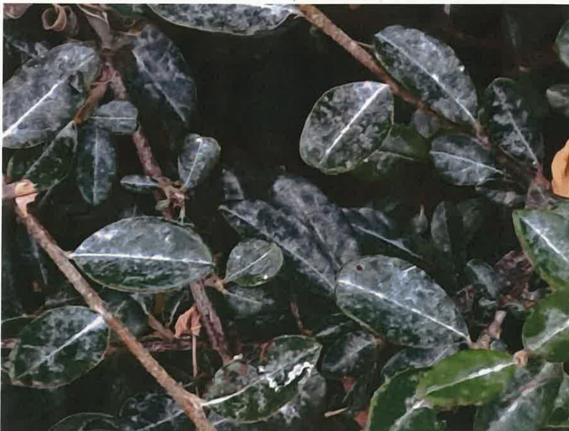
1. kép: A kerti növényeken látható porszenyeződés 1. (Irinyi D. u. , 2025.)

Az alábbi fotók a közvetlenül a bánya alatt, aszfaltozott utcák mellett fekvő ingatlanokon készültek. A képeken a bánya által kibocsátott por hatása egyértelműen látható és bizonyítja, hogy a dokumentációban szereplő: „a képződő por a képződésének helye közelében a bányatelek határain belül leülepszik” megállapítás teljesen téves és A POR HATÁSA A LAKÓTERÜLETEN JELENTKEZIK!