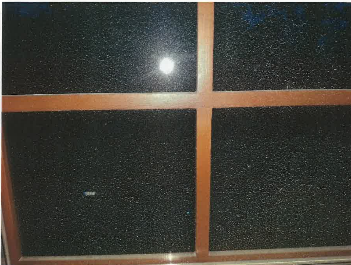
6. kép: A ház ablakain látható porszenyeződés, mely nem a takarítás hiánya miatt jelentkezik 1. (Irinyi D. u. , 2020.)